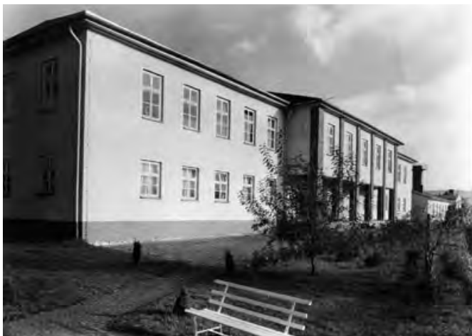
So sah es einst aus: Das Schulungsheim des dkk-Scharfenstein in Gehringswalde.